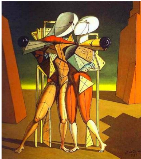
Giorgio de Chirico

- Influência da arte metafísica de Giorgio de Chirico, em que sombras são projetadas dentro da pintura provenientes de objetos externos;