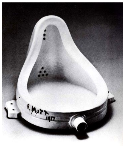
A fonte, de Duchamp

- Surgimento dos ready-mades (objetos fabricados industrialmente exibidos com pouca ou nenhuma alteração).