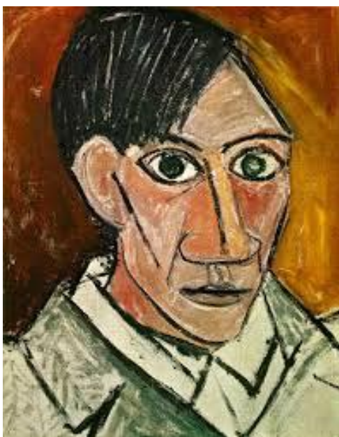
Pablo Picasso "auto retrato"