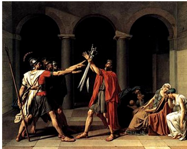
Jacques-Louis David (1748-1825) O Juramento dos Horácios, 1784, Óleo sobre tela, 3,30 x 4,25 m Museu do Louvre, Paris.