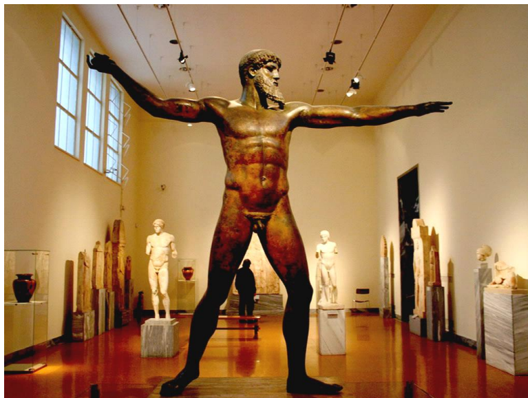
Estátua de Zeus ou Poseidon.