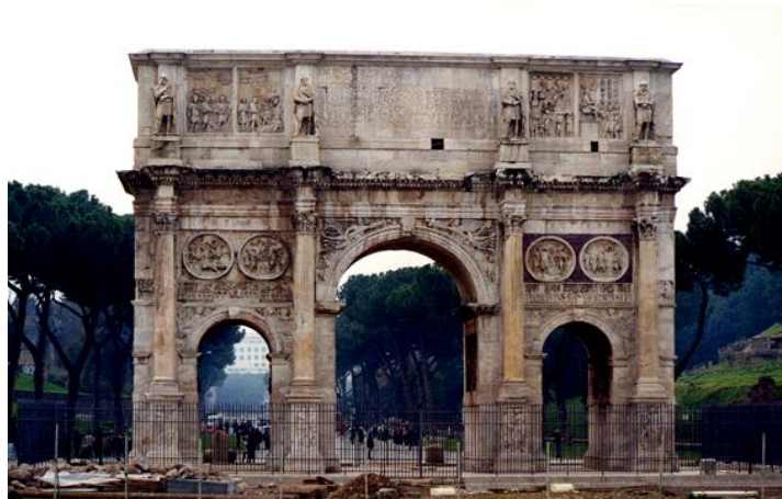
Arco do Triunfo

- O arco romano: Estrutura arquitetônica que permite uma maior circulação na parte interna das edificações. Foi uma grande inovação já que os pilares gregos necessitavam estar muito próximos, pois a pedra que eles utilizavam nas construções não suportava muita tensão; o arco, portanto, solucionou esse problema, aumentando o espaço e aprimorando a questão funcional e estética.